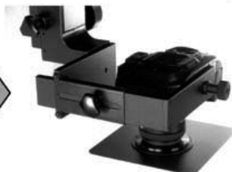
【カメラ正逆アダプター取付】