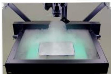
換気装置運転時の気流の流れ