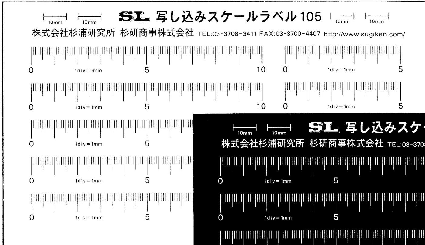
白タイプ (黒目盛り) [スケール幅 12mm、10cm5本 5cm5本/1シート]